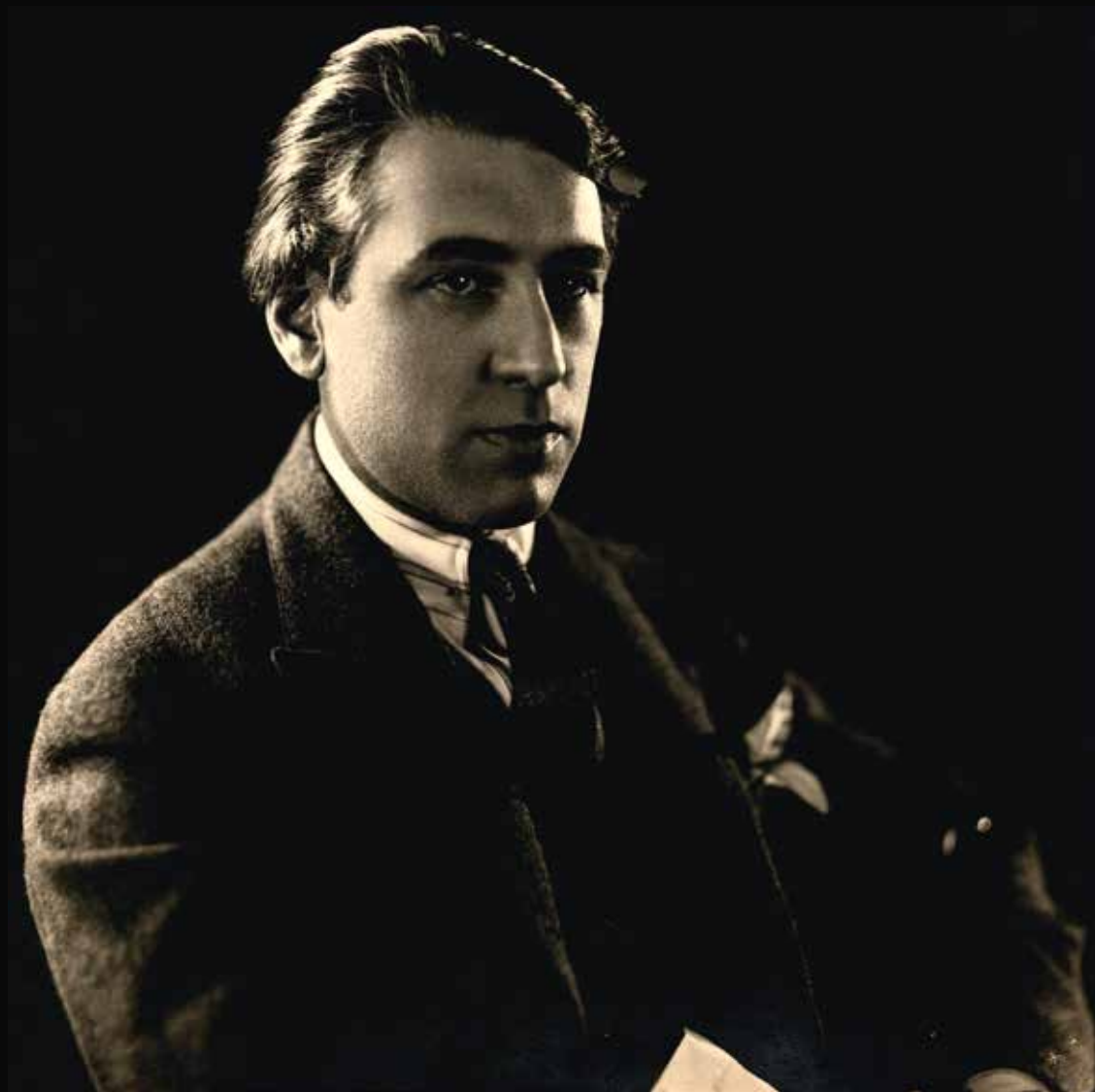
Abel Gance à l'époque de la réalisation de Napoléon copy. La Cinémathèque française