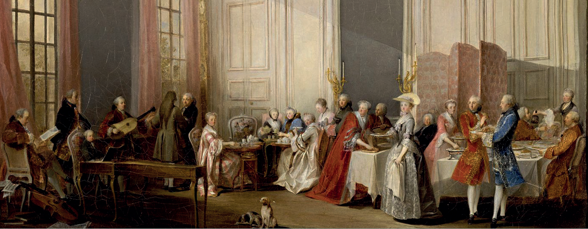
© Le thé à l'anglaise dans le salon des Quatre-Glaces au Temple, avec toute la cour du prince de Conti écoutant le jeune Mozart, toile de Michel Barthelemy Ollivier présentée au Salon de 1777, Musée du Louvre, Paris