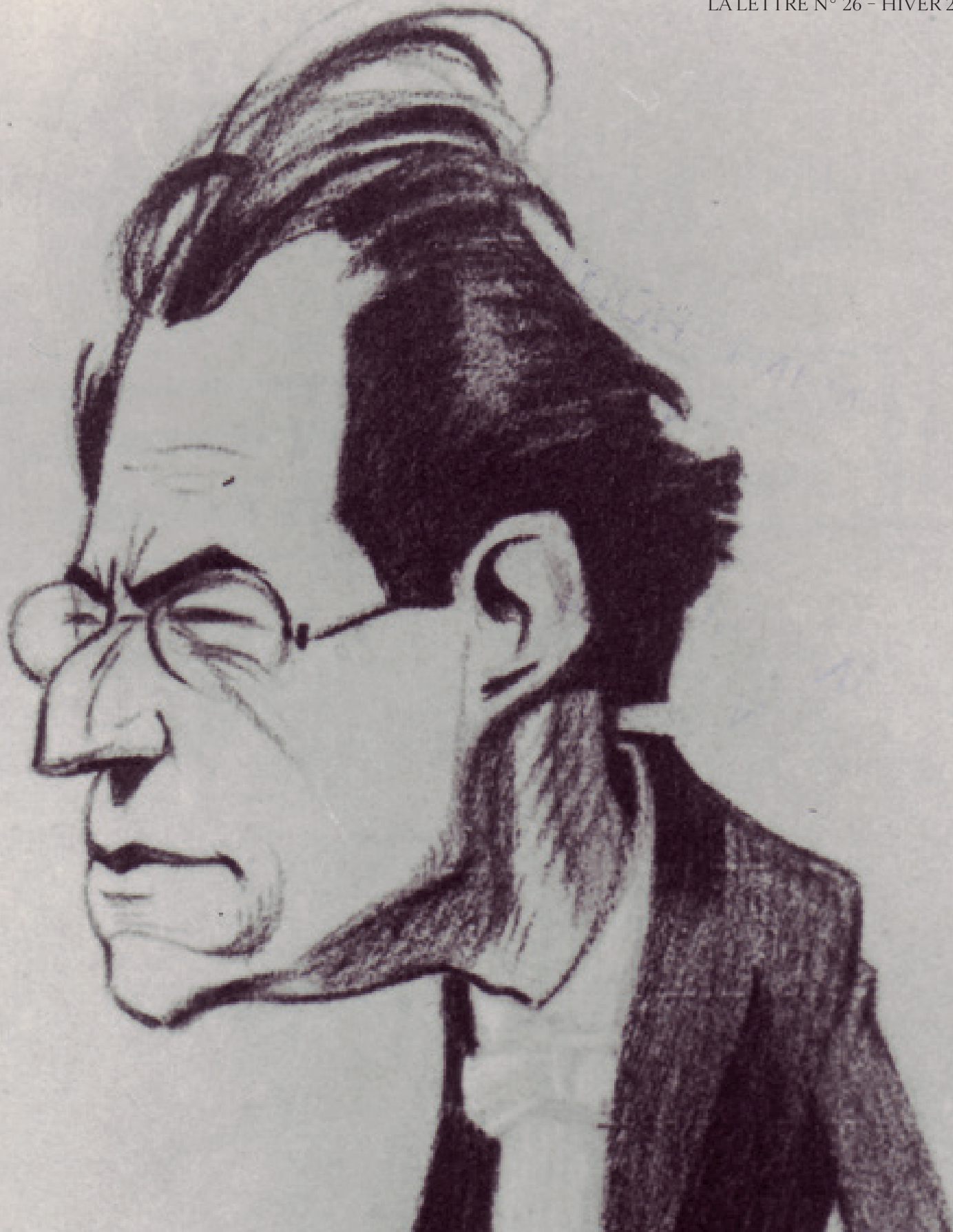
Gustav Mahler